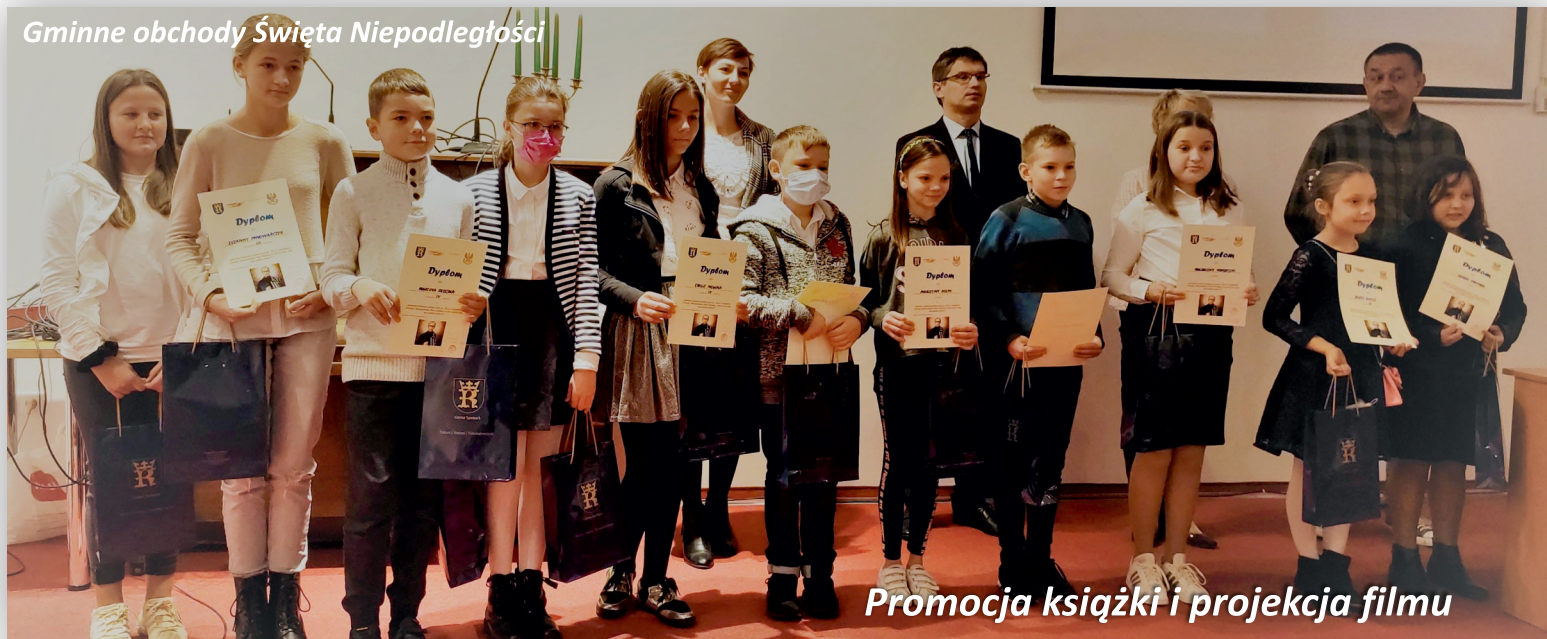
Promocja książki i projekcja filmu