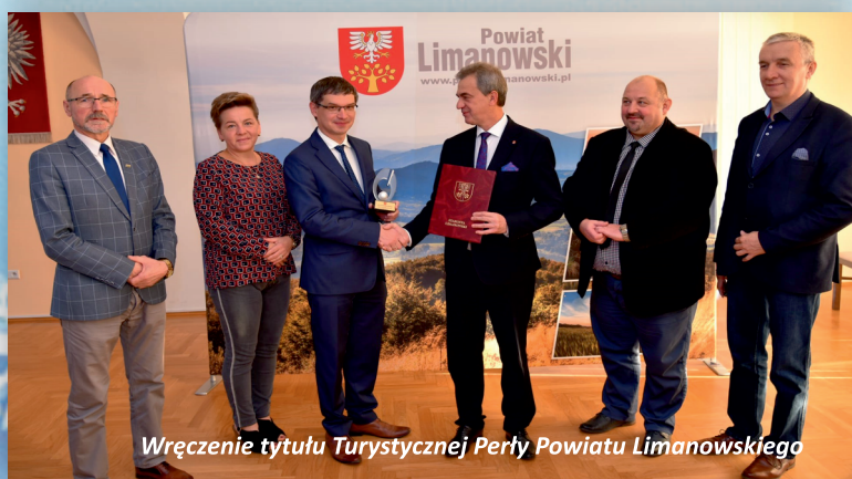
Wręczenie tytułu Turystycznej Perły Powiatu Limanowskiego