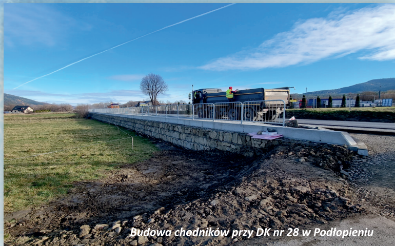
Budowa chodników przy DK nr 28 w Podłopieniu