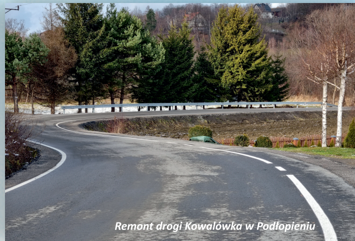
Remont drogi Kowalówka w Podłopieniu