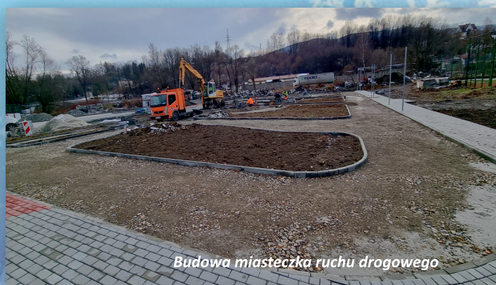
Budowa miasteczka ruchu drogowego