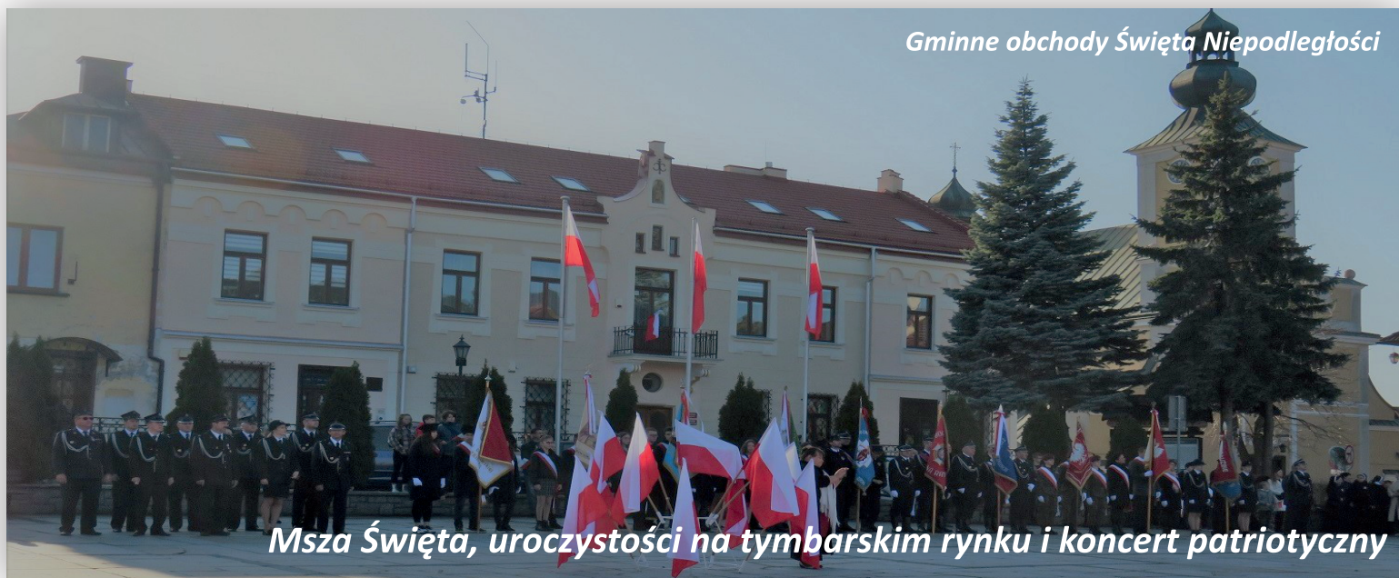
Msza Święta, uroczystości na tymbarskim rynku i koncert patriotyczny