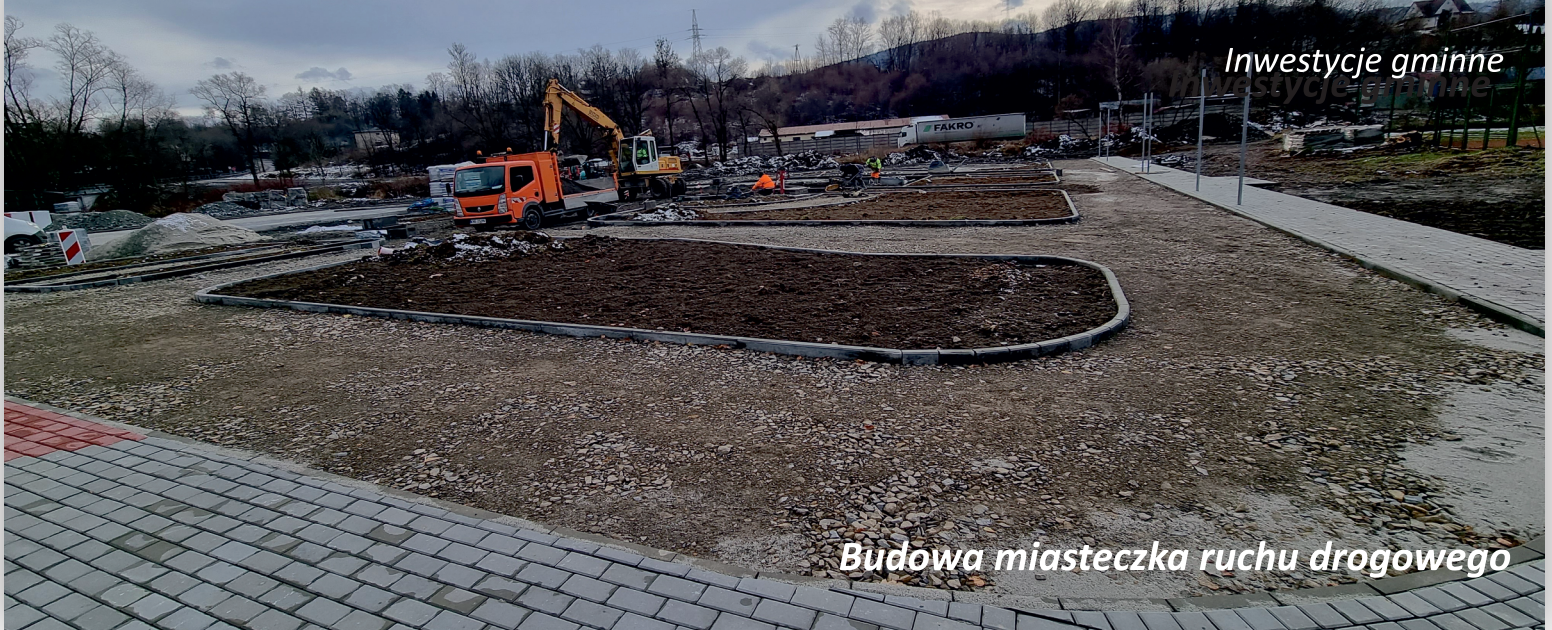
Budowa miasteczka ruchu drogowego

W październiku br. rozpoczęła się Budowa miasteczka ruchu drogowego dla rowerów w Tymbarku oraz parkingu . Inwestycja dofinansowana jest z budżetu Województwa Małopolskiego w ramach projektu Małopolska infrastruktura rekreacyjno-sportowa – MIRS w 2021 roku oraz Rządowego Funduszu Inwestycji Lokalnych .