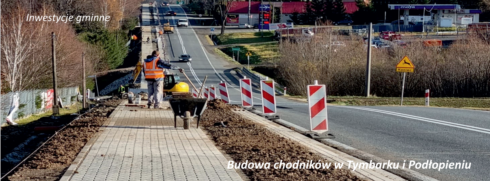
Budowa chodników w Tymbarku i Podłopieniu

Trwają prace końcowe przy budowie chodników przy drodze krajowej nr 28 w Tymbarku i Podłopieniu . Wartości inwestycji to około 8 mln zł.