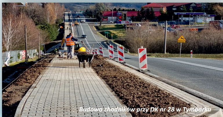
Budowa chodników przy DK nr 28 w Tymbarku