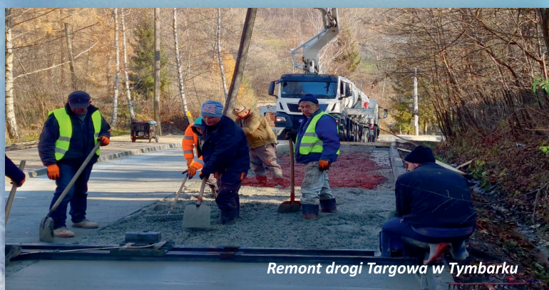
Remont drogi Targowa w Tymbarku