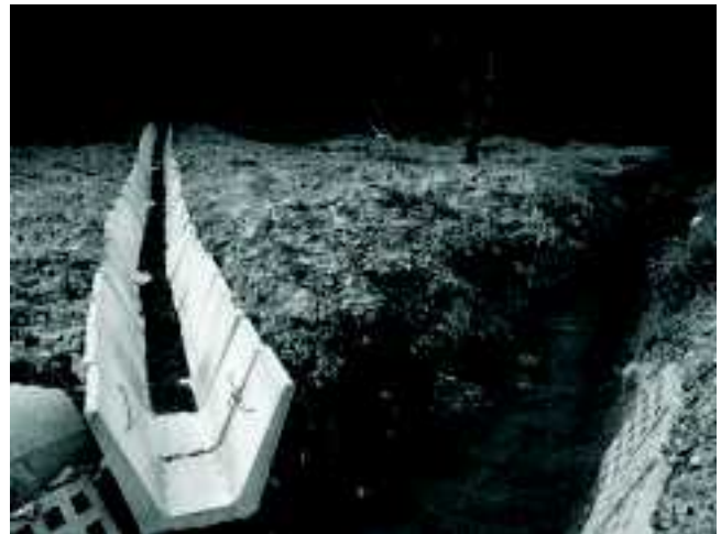
(malowanie mostu w Piekielku, wykonanie rowu odwadniającego w Podłopieniu)