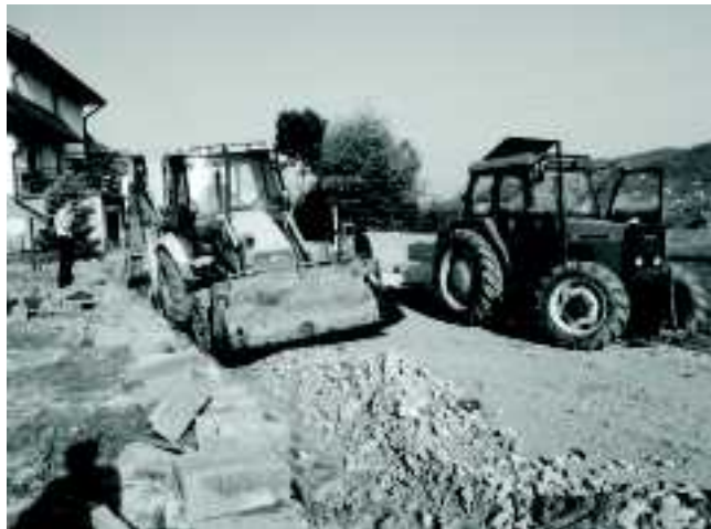
(przebudowa przepustów w Zawadce, budowa drogi na osiedlu Kwaśniakówka)

Przewodniczący Komisji Rolnictwa, Ochrony Środowiska i Gospodarki Komunalnej Zbigniew Papież