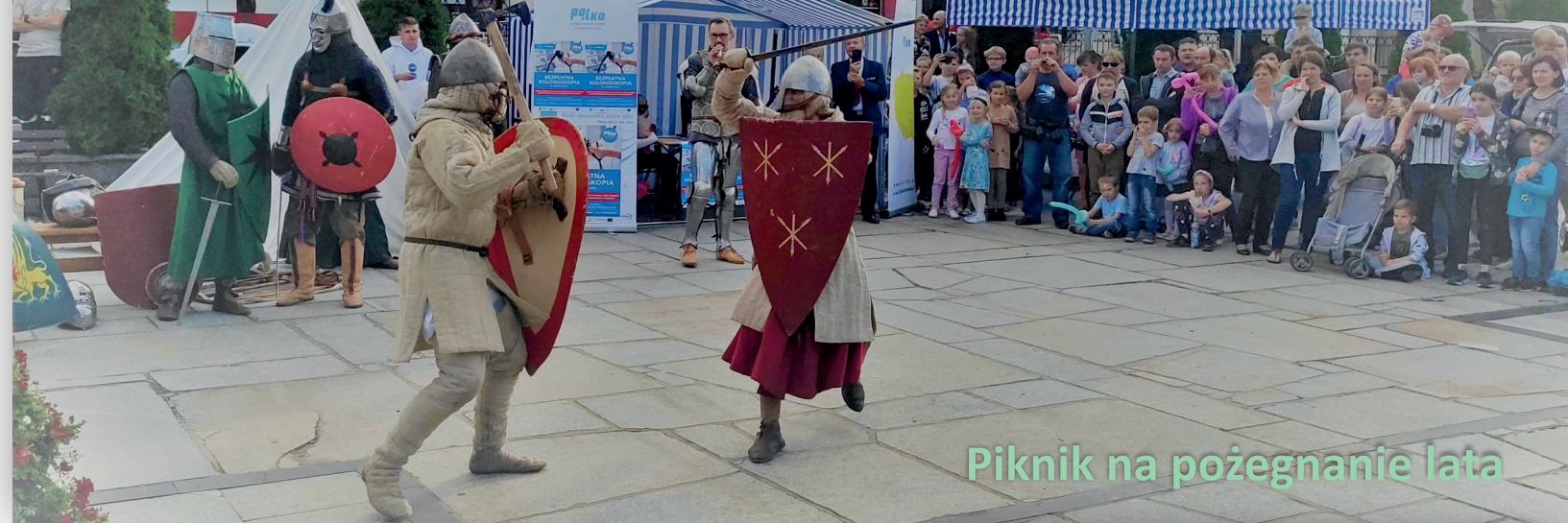
Piknik na pożegnanie lata

29 września na tymbarskim rynku, podczas pikniku pożegnaliśmy lato. Imprezę rozpoczął teatr lalek z udziałem dzieci pt. O Królowie Śnieżce i siedmiu krasnoludkach połączony z zabawami i konkursami dla najmłodszych i rodzin.