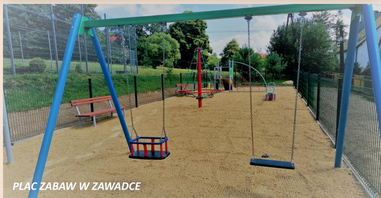
PLAC ZABAW W ZAWADCE