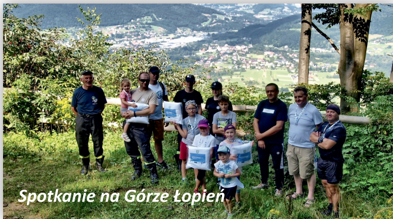
Spotkanie na Górze Łopień