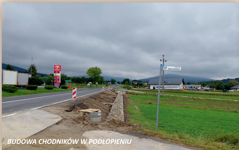
BUDOWA CHODNIKÓW W PODŁOPIENIU