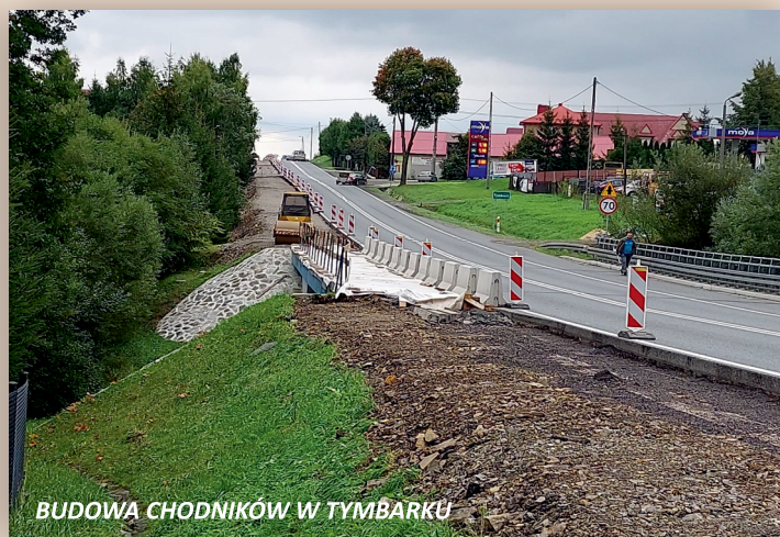
BUDOWA CHODNIKÓW W TYMBARKU