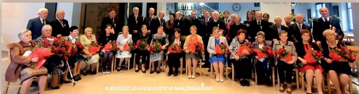
JUBILEUSZ 50-LECIA POŻYCIA MAŁŻEŃSKIEGO