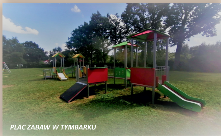
PLAC ZABAW W TYMBARKU