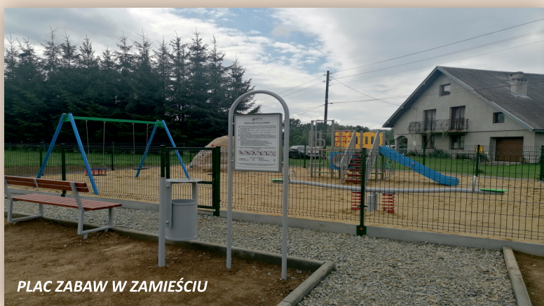
PLAC ZABAW W ZAMIEŚCIU